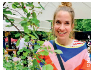
Künstlerin: Maren Collet