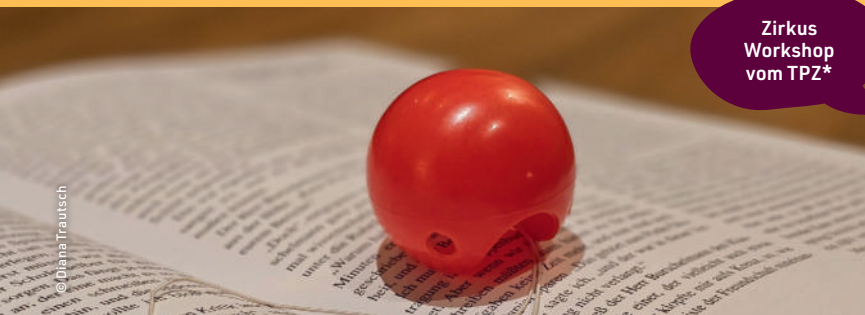
Zirkus Workshop vom TPZ*