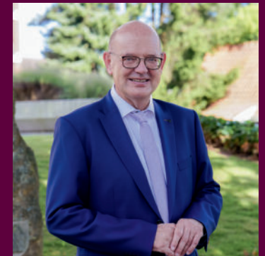
MARC-ANDRÉ BURGDORF Präsident der Emsländischen Landschaft e.V. Landrat des Landkreises Emsland