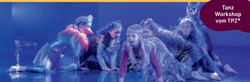
Tanz Workshop vom TPZ*