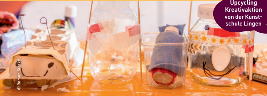
Upcycling Kreativaktion von der Kunst- schule Lingen